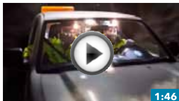
1:46 VIDÉO SUR LA NOUVELLE SÉRIE 2600

Xylect Pompes de drainage Flygt au bout de vos doigts